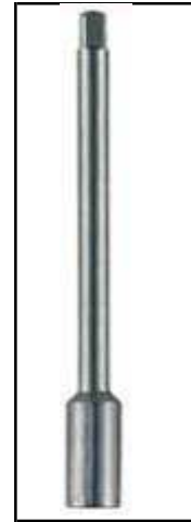
Gewindebohrer- verlängerungen 9330