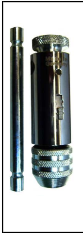
Werkzeughalter mit Ratsche